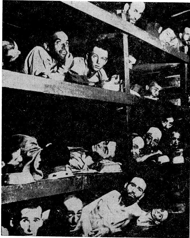
אַזוי האָבן אויסגעזען די שטייגן, וווּ די קאָצעטלערס האָבן זיך „אַפּגערוט“...